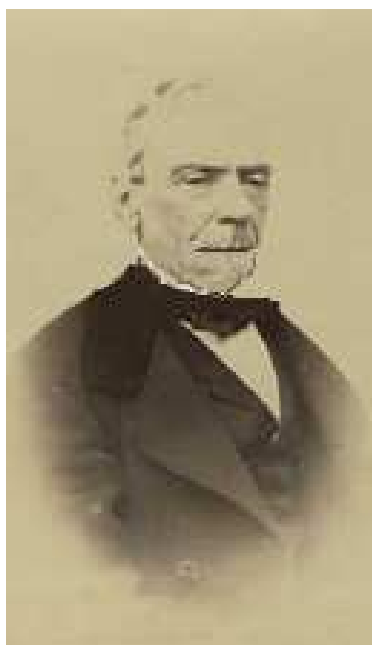
Retrato del Presidente José Joaquín Pérez Mascayano, 1865.

En este contexto, durante septiembre de 1865, se hace presente en Valparaíso la escuadra española a cargo del almirante Juan Manuel Pareja, quien exigió un saludo oficial a la bandera hispana. Siete días después, el presidente chileno José Joaquín Pérez en acuerdo con el Congreso, declaró la guerra a España.