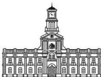
MUSEO HISTÓRICO NACIONAL