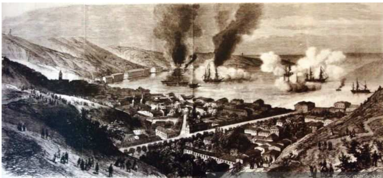
Bombardeo de Valparaíso. Guerra contra España, 31 de marzo de 1866.

Casto Méndez trató de repetir este ataque en el Callao, pero fue duramente resistido por las sólidas fortalezas de este puerto. La escuadra española debió dejar Sudamérica. Por su parte el gobierno Chileno fortificó Valparaíso y adquirió dos corbetas. En 1867 Chile y España acceden a un tratado de tregua, sin embargo el tratado de paz definitivo se firmó en 1883.