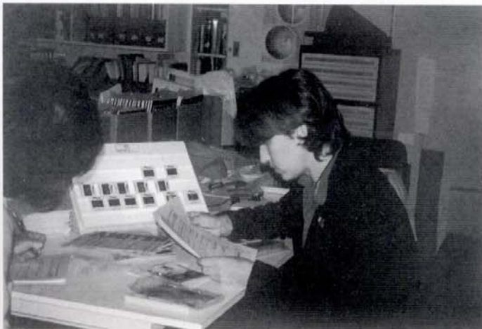
Foto 2. Catalogación, clasificación y preparación del material con apoyo del visor de diapositivas. Fotografía: Gloria Román, 1998.

La puesta en valor de este vasto material fotográfico ha permitido que este nuevo Archivo se constituya en una valiosa herramienta para los profesionales del CNCR , por su accesibilidad y facilidad en el uso. Por otra parte, el ingreso de toda la información de este Archivo a la base de datos de la biblioteca ha logrado una óptima recuperación de la información existente en todos los archivos del Centro.