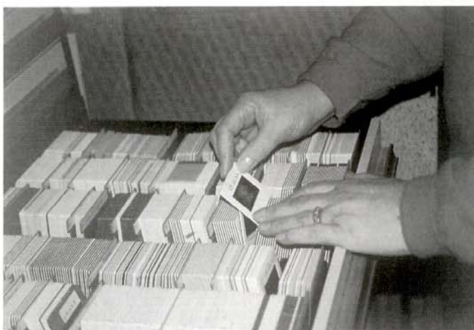
Foto 5. Organización de las diapositivas dentro del kárdex. Fotografía: Gloria Román, 1998.