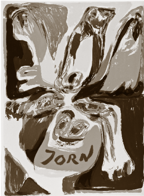
Uden titel [Sin título], 1970 Litografía a color. 760 x 550 mm Museo Jorn, Silkeborg