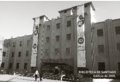
BIBLIOTECA DE SANTIAGO Edificio de 2005.