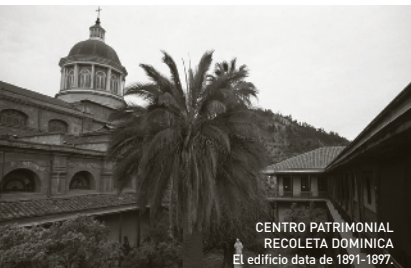
CENTRO PATRIMONIAL RECOLETA DOMINICA El edificio data de 1891-1897.