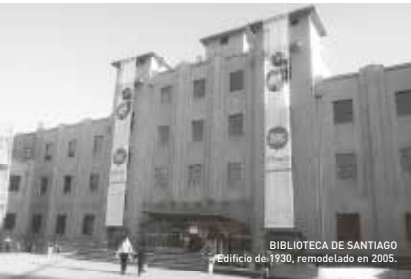
BIBLIOTECA DE SANTIAGO Edificio de 1930, remodelado en 2005.