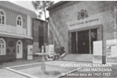
MUSEO NACIONAL BENJAMÍN VICUÑA MACKENNA El edificio data de 1947-1957.