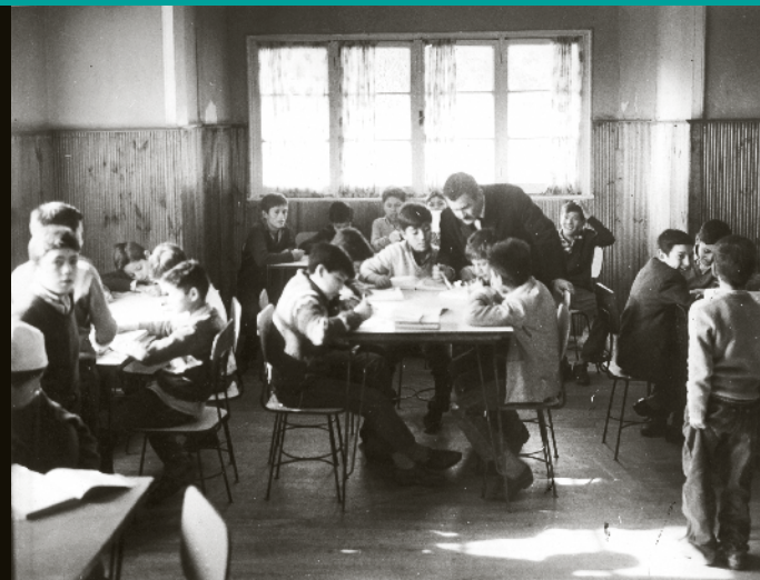
"Alumnos de educación básica junto a su profesor", sin fecha.

El edificio que alberga al museo, inaugurado en 1886, abrió sus puertas como la Escuela Normal N° 1 de Niñas, una de las instituciones más importantes en la preparación del profesorado femenino del país y, casi un siglo después, en 1981, acogió al Museo Pedagógico de Chile, que nace de la Exposición Retrospectiva de la Enseñanza organizada en 1941, como parte de las celebraciones conmemorativas del cuarto centenario de la fundación de la ciudad de Santiago.