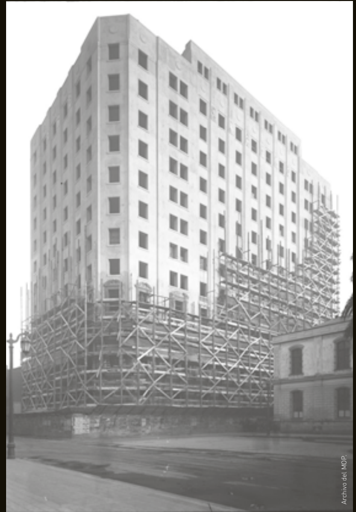
Construcción del edificio del Ministerio de Hacienda, en calle Teatinos.