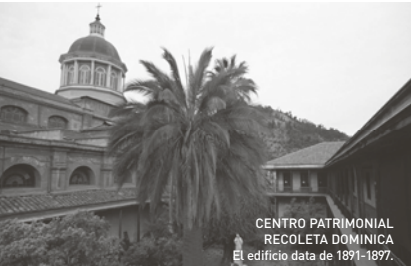
CENTRO PATRIMONIAL RECOLETA DOMINICA El edificio data de 1891-1897.